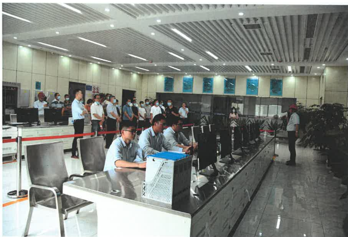
图 1: 环保设施公众开放日照照片

参观结束后，公众纷纷表示广德公司环境整洁优美，积极履行国企社会责任，为广德市的生态文明建设工作贡献了力量。